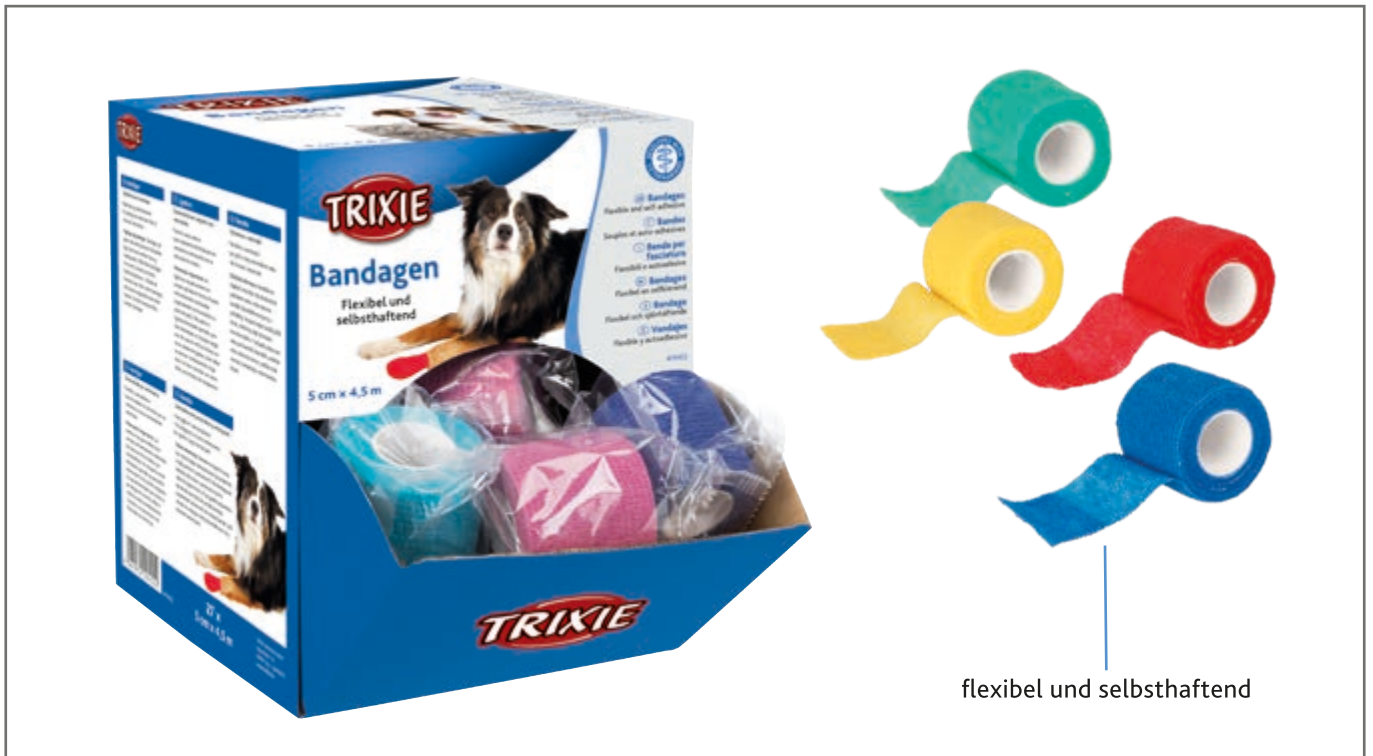
flexibel und selbsthaftend