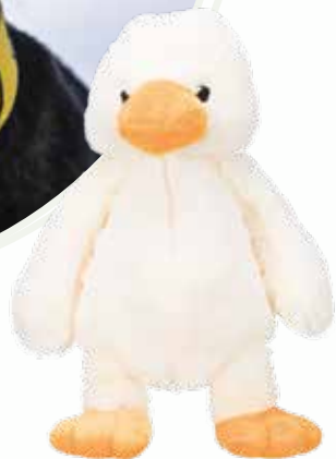
Jouet pour chiens