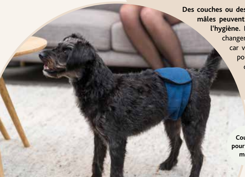
Couches pour chiens mâles

Des couches ou des couches pour chiens mâles peuvent également améliorer l'hygiène. Il est important de les changer suffisamment souvent car votre vieux compagnon pourrait ne pas en apprécier l'odeur.