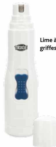
Lime à griffes

Des contrôles réguliers chez le vétérinaire sont importants afin de diagnostiquer des maladies telles que l'arthrose et le diabète. Les chats, en particulier, développent souvent une insuffisance rénale. Les maladies de la thyroïde ne sont pas rares non plus. Ce qui est important : Plus tôt une maladie (chronique) est diagnostiquée, mieux c'est ! Aujourd'hui, il existe des vétérinaires spécialisés dans de nombreux domaines médicaux, tels que le cœur, les yeux et le diabète.