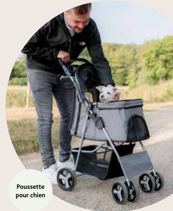
Poussette pour chien

Pour les chats âgés, il est important que le bac à litière soit rapide et facile à atteindre. Des bacs à litière supplémentaires peuvent raccourcir le chemin.