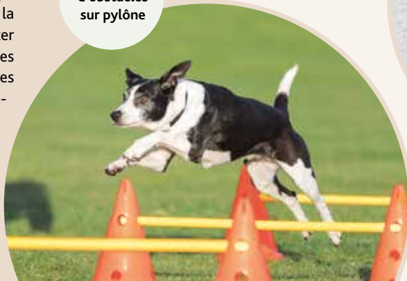
Set d'obstacles sur pylône