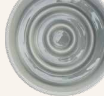
Gamelle Slow Feeding