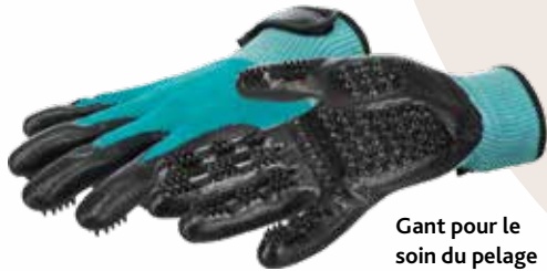
Gant pour le soin du pelage