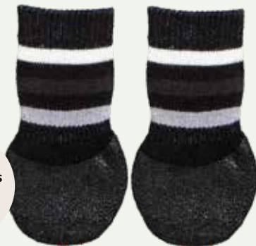
Chaussettes pour chiens

En été, la chaleur peut être un problème. Bien sûr, il faut toujours prévoir un endroit à l'ombre et de l'eau pour boire. En plus de cela, des matelas rafraîchissants peuvent aider votre animal à se sentir bien. Il est préférable de faire des promenades tôt le matin ou le soir, lorsque le temps s'est rafraîchi.