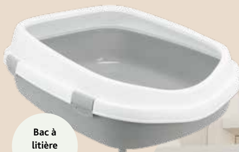
Bac à litière Primo XXL

Lorsque le dos du chat n'est plus souple et que se retourner devient difficile, le bac à litière doit être un peu plus grand. Une entrée basse ou une rampe facilite l'entrée et la sortie.