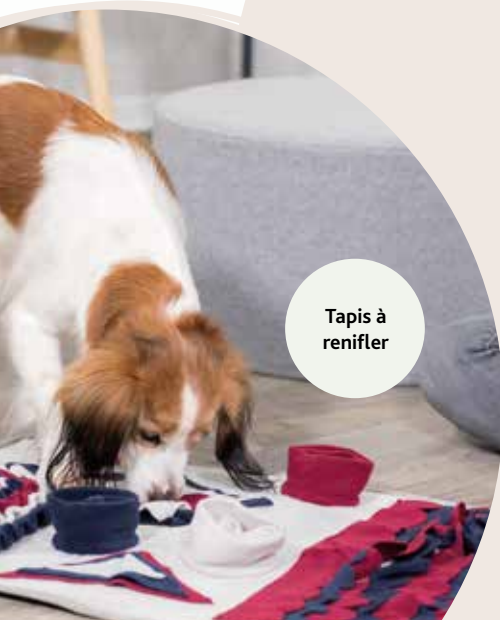
Tapis à renifler

Souvent, les animaux déments ne connaissent pas leurs limites physiques. Si les forces de votre animal âgé faiblissent lors d'une promenade, un harnais permet de le stabiliser. C'est également une bonne idée de s'équiper d'une poussette, un chariot ou quelque chose de similaire. Ainsi, votre chien peut décider quand et dans quelle mesure il doit courir ou se reposer.