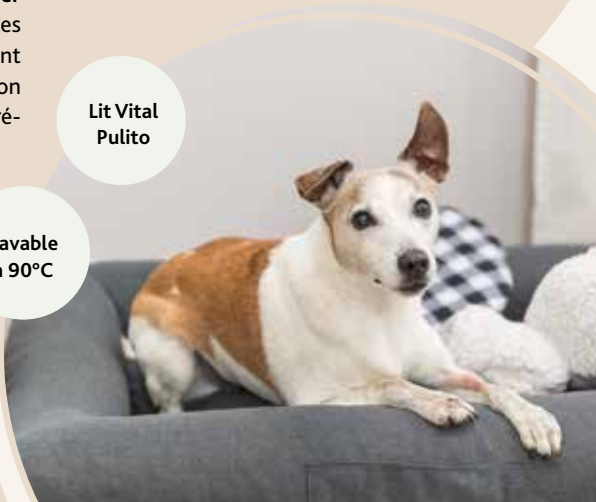
lavable à 90°C