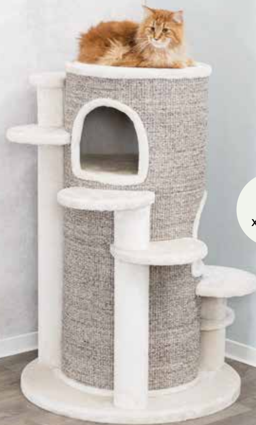
Arbre à chat XXL Oskar