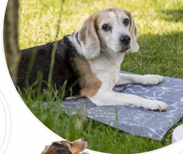
BE NORDIC Sweat

Les chiens qui ont des difficultés à se relever sur des sols glissants peuvent être aidés si vous leur fournissez un tapis antidérapant. Les chaussettes antidérapantes sont également utiles. L'adhérence supplémentaire permet au chien de se lever et de marcher plus facilement.