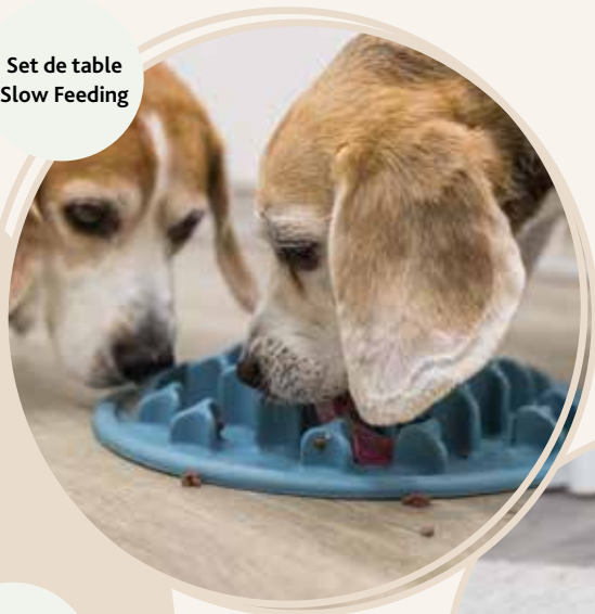
Set de table Slow Feeding

Les produits Slow Feeding ralentissent la prise de nourriture. L'alimentation est plus excitante pour votre animal et l'occupe plus longtemps. Si votre animal engloutit la nourriture, ces produits peuvent aider à lutter contre l'hyperacidité, les flatulences et les crampes. Le léchage détend également les chats et les chiens. Il s'agit d'un effet secondaire utile, en particulier pour les animaux atteints de démence qui ont tendance à être agités, qui peut aider à commencer la journée en douceur ou à se détendre pour la nuit.