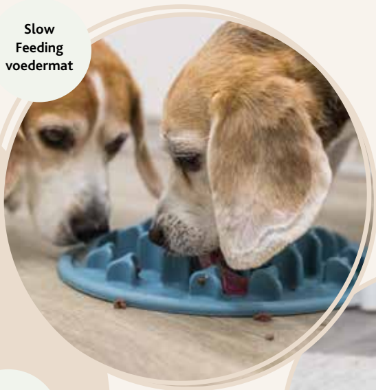
Slow Feeding voedermat