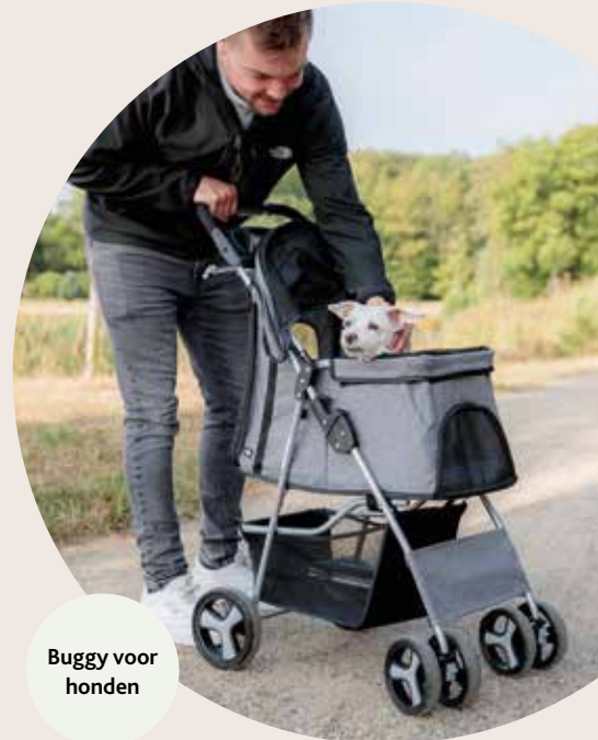
Buggy voor honden

Voor kattenpapa's en -oma's is het nu belangrijk dat de kattenbak snel en gemakkelijk te bereiken is. Extra kattenbakken verkorten de afstanden.