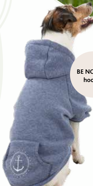
BE NORDIC hoodie