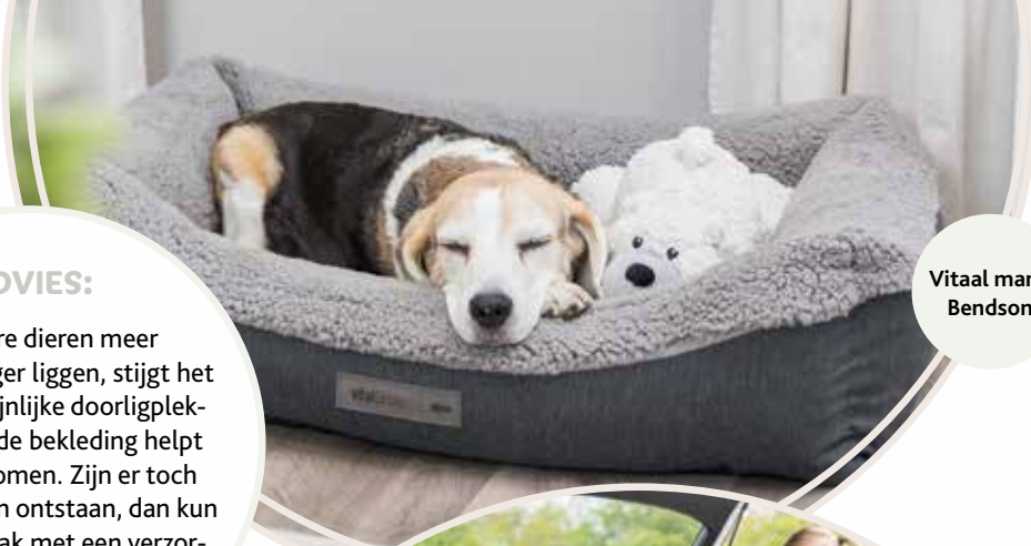
Vitaal mand Bendson

Als oudere dieren meer slapen en langer liggen, stijgt het gevaar van pijnlijke doorligplekken. Een goede bekleding helpt die te voorkomen. Zijn er toch doorligwonden ontstaan, dan kun je het ongemak met een verzorgende crème verlichten.