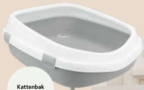
Kattenbak Primo XXL

Wanneer de rug niet meer zo soepel is en het omdraaien zwaarder gaat vallen, is het goed als de kattenbak een beetje groter is. Een lage instap of een loopplank helpen bij het erin en eruit komen.